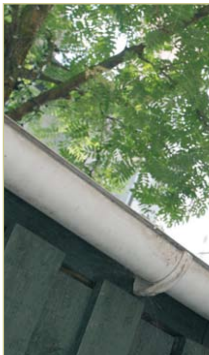
Inden du starter på facaden, er det en god ide at rense tagrender og nedløbsrør.

Tip En facademaling skal altid være diffusionsåben, d.v.s. den skal kunne ånde, og samtidig give beskyttelse mod vejrliget. Sigma har facademalinger til næsten enhver tænkelig opgave.